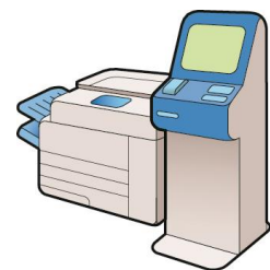
図. マルチコピー機

マイナンバーカードを利用して、コンビニ等のマルチコピー機で、住民票の写しや印鑑登録証明書などを取得できるサービスです。