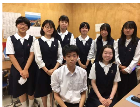
↑ 放送委員会の皆さん ↓