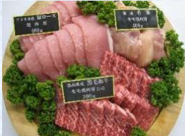
写真は和牛焼肉セット(5,000円)のイメージ写真です