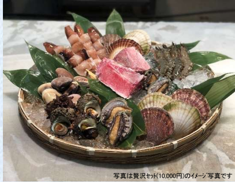
写真は贅沢セット(10,000円)のイメージ写真です