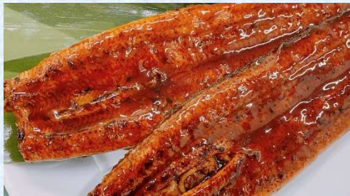
写真はうなぎ長焼(5,000円)のイメージ写真です

④市場厳選 魚介おすすめセット 5,000円(税込) [内容例]キンメダイ / イサキ / アジ / ヤリイカ等 ※ウェブ限定大漁セット10,000円、贅沢セット15,000円あります