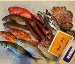
写真は賢沢セット(15,000円)のイメージ写真です

⑤ 真空干物4枚セット [A] 2,000円(税込) 赤魚・アジ・サバ・鯖ホッケ ⑥ 干物セット [B] 3,000円(税込) 干カレー・開きアジ・塩サバなど合計6種類 ⑦ 高級干物セット [C] 5,000円(税込) 開きサバ2枚・開きホッケ2枚・マトウ鯛2枚・開き赤魚1枚