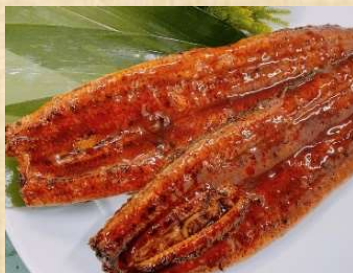
写真は土用丑の日!うなぎ(5,000円)のイメージ写真です