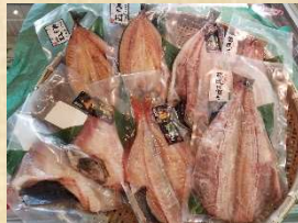
写真はセット[C](5,000円)のイメージ写真です

④ 熟成魚セット 5,000円(税込) 特殊な技法で活けた魚を数日間熟成させた通常入手困難な商品です。養殖 真鯛・シマアジ・ヒラメ 身卸し半身パック