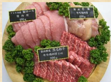
写真は和牛焼肉セット(5,000円)のイメージ写真です

⑧ 市場厳選 魚介おすすめセット 5,000円(税込) [内容例]キンダイ・イサキ・アジ・ヤリカ等 ⑨ 市場厳選 魚介大漁セット 10,000円(税込) [内容例]キンダイ・イサキ・アジ・ヤリカ・目光・ホタテ・ホッキ貝 等 ⑩ 市場厳選 魚介賢沢セット 15,000円(税込) [内容例]キンダイ・のどぐろ・ヤリカ・ホタテ・ホッキ貝・アブリ・ウニ 等