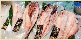
写真はセット[A](2,000円)のイメージ写真です

⑤ 真空干物4枚セット [A] 2,000円(税込) 赤魚・アジ・サバ・鯖ホッケ ⑥ 干物セット [B] 3,000円(税込) 干カレー・開きアジ・塩サバなど合計6種類 ⑦ 高級干物セット [C] 5,000円(税込) 開きサバ2枚・開きホッケ2枚・マトウ鯛2枚・開き赤魚1枚