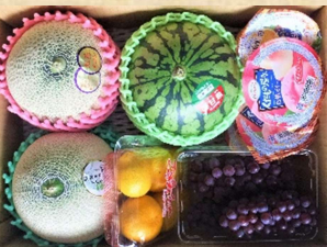
写真は厳選フルーツセット(4,000円)のイメージ写真です

⑲ 山梨県産シャインマスカットと宮崎県産完熟マンゴーのセット 4,500円(税込)