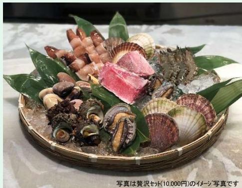
写真は贅沢セット(10,000円)のイメージ写真です

◆BBQ海鮮贅沢セット 10,000円(税込) 韓国産養殖生アワビ4個 / 千葉県産生サザエ4個 / 千葉県産大ハマグリ8個 / 青森県または北海道産殻付きホタテ8枚 / インドネシア産ブラックタイガー4尾 / 中国産スルメイカ串4本 / 各地生マグロのカマ2個