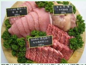
写真は和牛焼肉セット(5,000円)のイメージ写真です