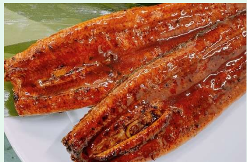
写真はうなぎ長焼(5,000円)のイメージ写真です

◆BBQ海鮮づくしセット 5,000円(税込) 千葉県産大ハマグリ8個 / 青森県または北海道産殻付きホタテ4枚 / インドネシア産ブラックタイガー4尾 / 中国産スルメイカ串4本 ※ウェブ限定お手軽セット3,000円あります ※スルメイカ串は入荷状況により予告なく商品変更となる場合があります