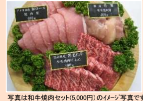
写真は和牛焼肉セット(5,000円)のイメージ写真です