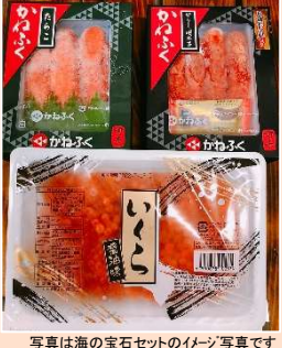
写真は海の宝石セットのイメージ写真です

ロシア産タラバ肩800g / アメリカ産ズワイ棒肉160g / アメリカ産ズワイブレイク 300g