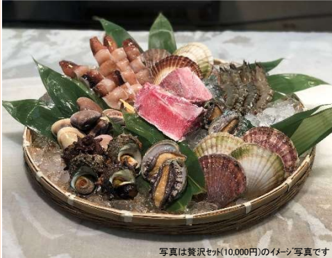
写真は贅沢セット(10,000円)のイメージ写真です