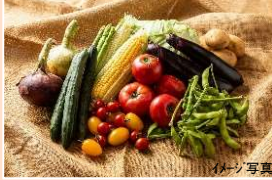
写真はイメージ写真です

ロシア産いくら醤油250g / アメリカ・ロシア産たらこ140g / アメリカ・ロシア産明太子140g