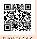
注文はこちらから