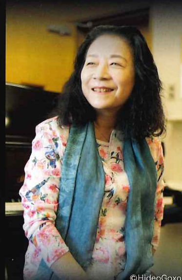
ピアニスト 青柳 いづみこ