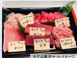
マグロ資沢セットイメージ