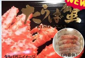
タラバガニイメージ