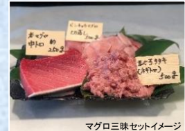
マグロ三昧セットイメージ