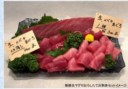
新鮮生マグロおろしてお刺身セットイメージ