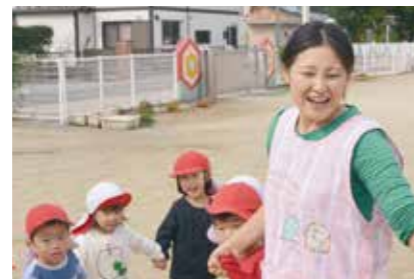
保育施設の整備充実(2021待機児童0)