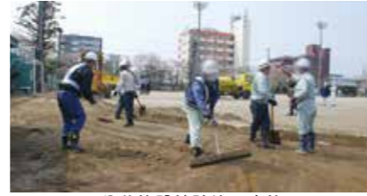
公共施設等除染の実施