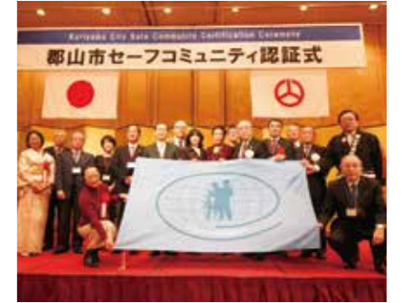
セーフコミュニティ国際認証取得