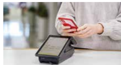
キャッシュレス化の推進