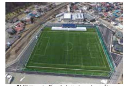
熱海フットボールセンターオープン