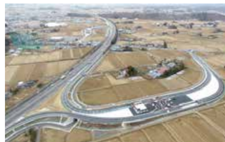
郡山中央スマートIC供用開始