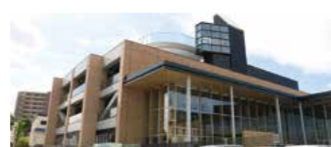
中央公民館・勤労青少年ホーム完成