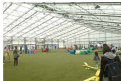
郡山カルチャーパーク屋内子どもの遊び場