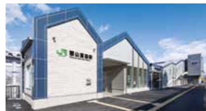
郡山富田駅(磐越西線)開業