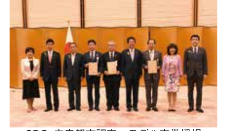
SDGs未来都市認定・モデル事業採択