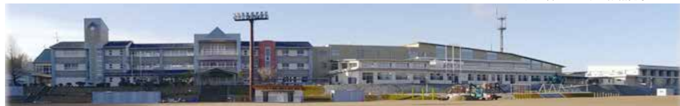
西田学園義務教育学校の開校