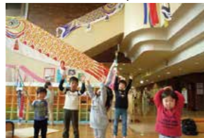
安全安心な子どもの居場所づくり