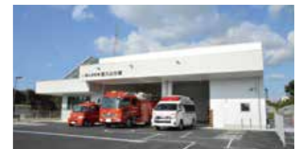
郡山消防署富久山分署の開署