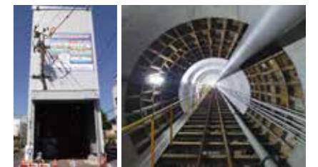
雨水貯留管(図景地区)の整備