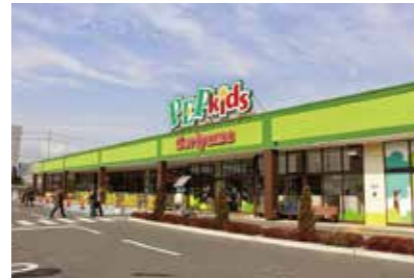
PEP Kids Koriyama