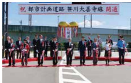
笹川大善寺線の全線供用