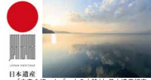
「未来を拓いた『一本の水路』」日本遺産認定