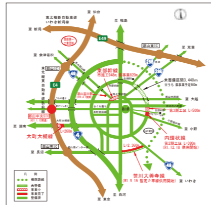
環状道路網の整備促進