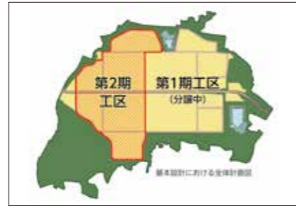
西部第一工業団地造成・企業進出