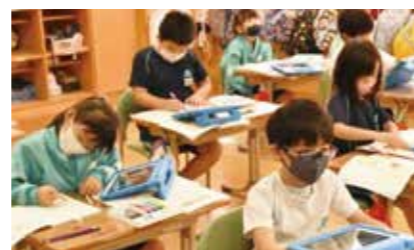
一人一台タブレット配備完了