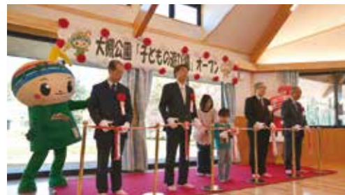
大槻公園子どもの遊び場