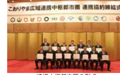
連携中枢都市圏の形成