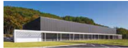
ふくしま逢瀬ワイナリーオープン