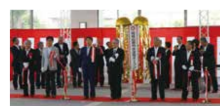
郡山しんきん開成山プールオープン