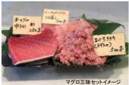
マグロ三昧セットイメージ