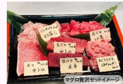
マグロ贅沢セットイメージ

◆新鮮生マグロ おろしてお刺身セット 3,000円(税込) めばちマグロ柵約300g / めばちマグロ切身約400g ◆マグロ三昧セット 5,000円(税込) 本マグロ中トロマルタ産等約250g / ピンチョウ切落とし国内加工500g / マグロタタキ(ネギト用) 国産500g ◆マグロ贅沢セット 10,000円(税込) 本マグロ中トロマルタ産等約350g / メバチ赤身台湾産等約200g / メバチ中トロ台湾産等約200g / メバチ切落とし台湾産等500g / ピンチョウ切落とし静岡加工500g / まぐらたき(ネギト用) 国産500g