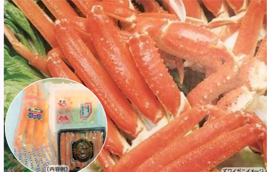
ズワイガニイメージ