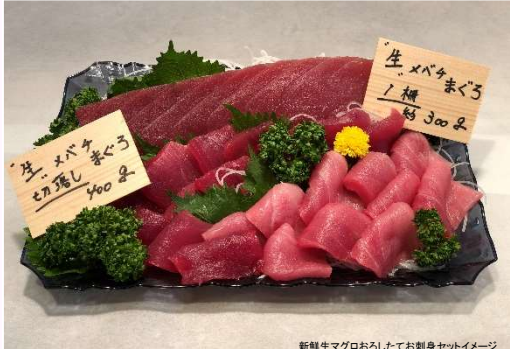
新鮮生マグロおろしてお刺身セットイメージ