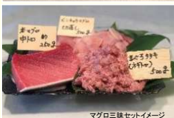
マグロ三昧セットイメージ

アメリカ産明太子500g / カナダ産味 付数の子500g / ロシア産紅鮭5 切れ / モロッコ産味付タコ200g / 国内 産海鮮しらす干し30g / 国内 産サーモン西京漬4切 / アメリカ産赤 魚粕漬4切