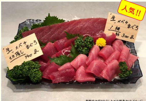
新鮮生マグロおろしてお刺身セットイメージ