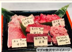
マグロ贅沢セットイメージ