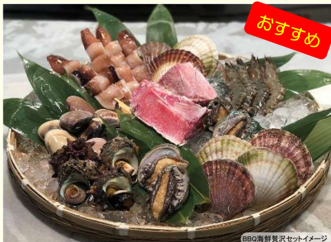
BBQ海鮮贅沢セットイメージ