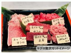
マグロ贅沢セットイメージ