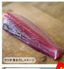
カツオ身おろしイメージ