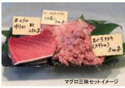
マグロ三昧セットイメージ