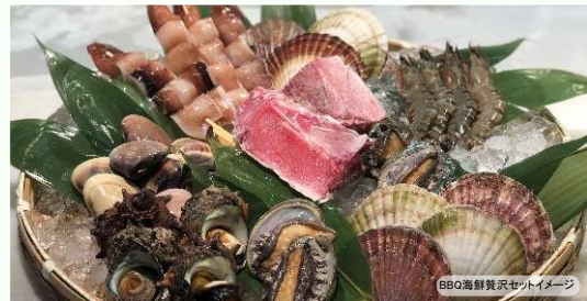
BBQ海鮮贅沢セットイメージ