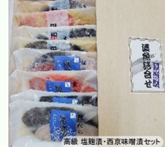
食卓にぎわいセット