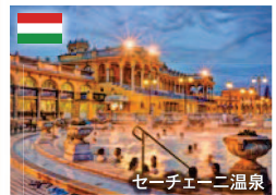
セーチェーニ温泉