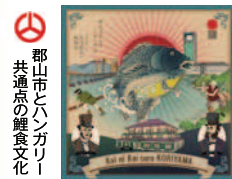
郡山市とハンガリー 共通点の鯉食文化