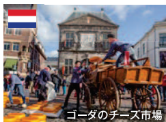
ゴダのチーズ市場