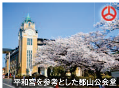
平和宮を参考とした郡山公会堂