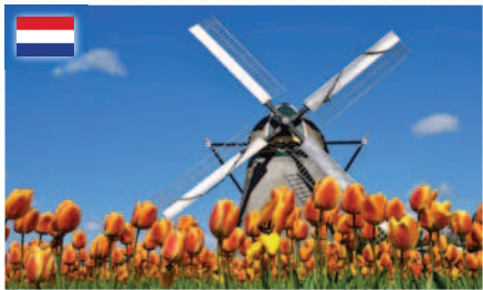
風車とチューリップ