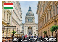
聖イシュトヴァーン大聖堂