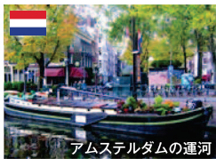
アムステルダム運河