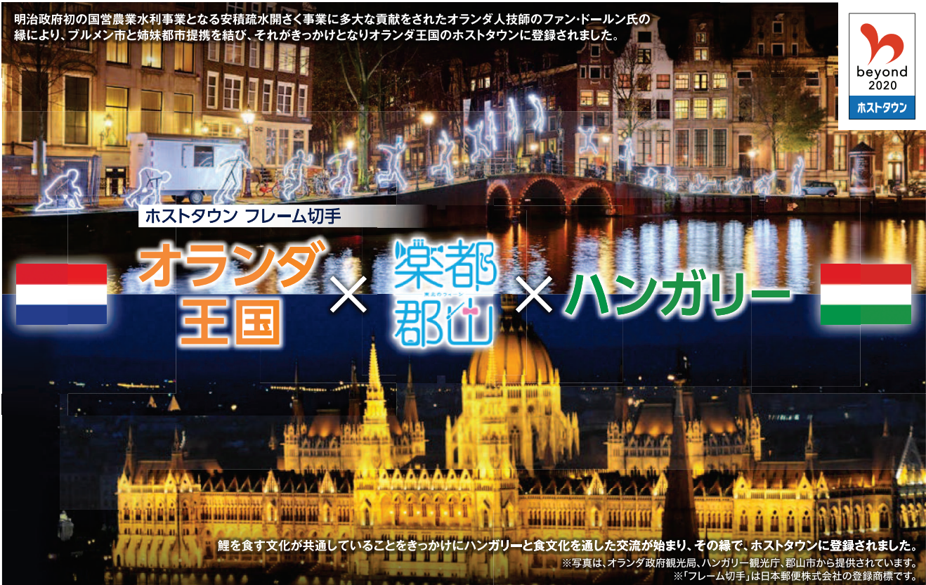
ホストタウン フレーム切手