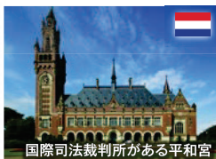
国際司法裁判所がある平和宮