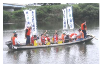
芭蕉も乗った渡し舟にて永盛小学校児童と舟下り