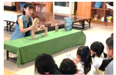
私たちの宝物 おはなし組木

おはなし会は、絵本に登場するぬいぐるみの展示や、ハーモニカを使い季節にちなんだ童謡やわらべうたをプログラムに取り入れるなど趣向を凝らし、誰もが笑顔で過ごせる時間を提供しています。