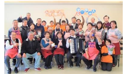
三穂田町の区長やボランティアなどが活躍しています！