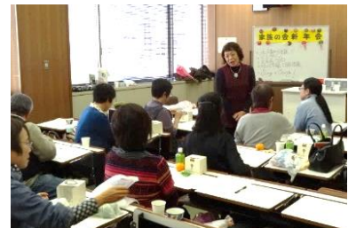
つどいで介護の悩みを共有

同じ悩みや課題を共有し共に支えあう場として、当事者同士が集える「相談会・交流会」と、何でも話せる息抜きの場、参加者と語り過ごせる場として、オレンジカフェを開催し、認知症になっても安心して暮らせる社会の実現に向け取り組んでいます。