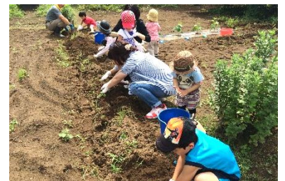
地域の畑を借りて芋堀