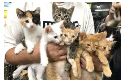
郡山市では年間約200 匹以上の猫が保護されます