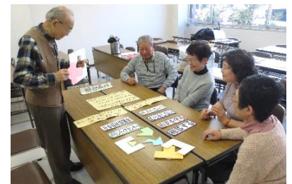
毎月のボランティア相談会の流れを確認