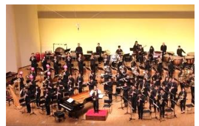
毎年開催のスプリングコンサート

音楽を通じたまちづくり活動により、音楽文化の向上、音楽都市こおりやまのイメージに貢献しています。