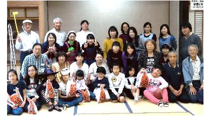
ジョイクラハロウィンパーティー

また、ドイツエッセン市と連携した音楽プロジェクトに参加し、「故郷」を歌唱した動画がYouTubeやSNSで配信されるなど、音楽都市郡山のイメージを国内外へ広げています。