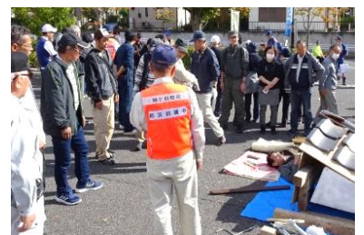
倒壊建物からの救出訓練

地区の防災訓練の企画をはじめ、地区防災計画の作成や防災だよりの発行などを通して、災害時の役割分担や活動内容の理解向上、防災意識の高揚に取り組んでいます。