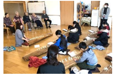
お箏体験 練習の成果を発表

河川の草刈り、ごみ拾いや堤防点検など河川の維持管理活動にとどまらず、舟下り、俳句会や歴史紙芝居などを通して、川の歴史、地域の歴史を伝える活動を行い、川に親しみをもってもらおう取り組みを行っています。