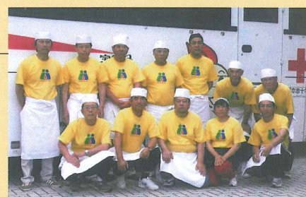
献血活動時の手打ちそば提供

地域の小学生への防犯意識の啓発を図るための「防犯教室と手打ち流しそば」や献血推進月間の献血活動時に手打ちそばを提供するなど、関係機関と連携した活動を行い地域振興に貢献している。