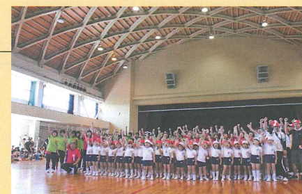
幼稚園運動会支援活動

また、震災後には、幼稚園の運動会開催にあたり、体育館を無償提供し、運営においても支援する等、スポーツを通じた地域支援活動を行っている。