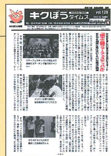
コミュニティ紙 発行活動

行政センターや公民館、地元小中学校等と連携し、一貫して町民に身近な情報を伝え、地域振興に貢献している。