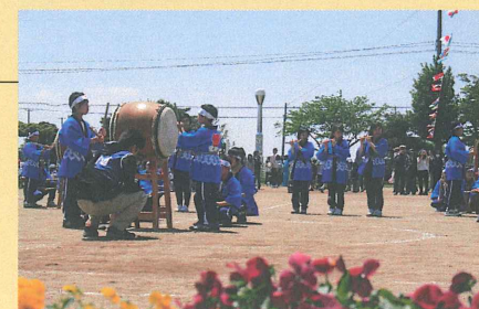
運動会での発表の様子

豊田太鼓クラブには4年生から6年生までが在籍し、上級生が下級生に教えるなど、伝統芸能を通じた青少年の健全な育成活動を行っている。