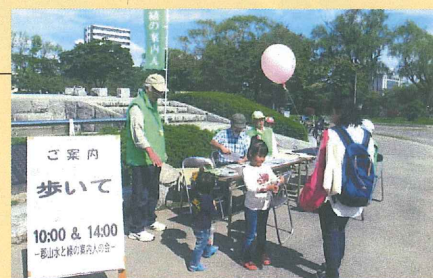
開成山公園案内の様子

郡山市内の史跡や緑の案内及び桜のシーズンの開成山公園の案内や安積疎水めぐりなど歴史文化の継承や郡山のPRに貢献している。