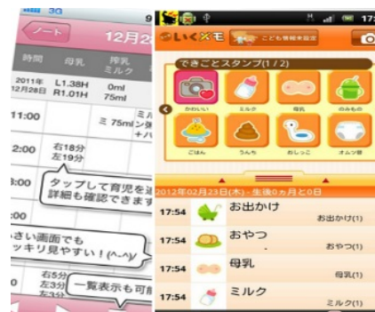
子育て支援アプリの情報発信内容 (イメージ)