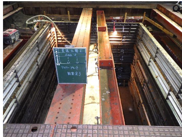
仮設土留(ライナープレート)設置状況