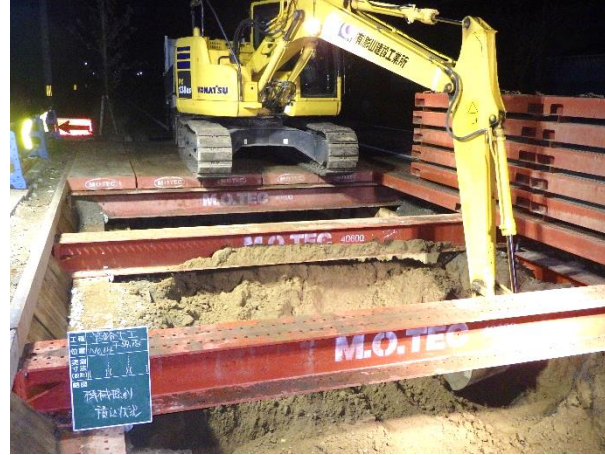
掘削・支保工状況