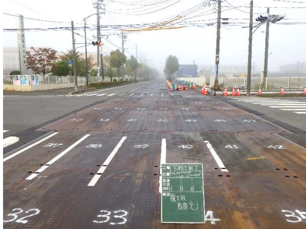
覆工板設置完了状況

10月は、覆工板設置を行い、特殊人孔築造に係る掘削・支保工に着手しました。 11月は、引き続き、掘削・支保工を行い、基礎工等に着手します。