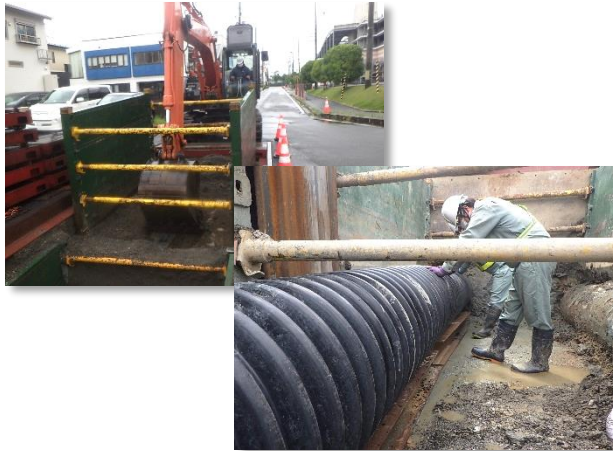
掘削・土留及び仮排水管設置状況

8月は、建込簡易土留を行いながら掘削、仮排水管設置及び導水管本体設置に支障となる既設排水管の撤去、導水管本体(ヒューム管)及び人孔設置を行い、施工延長約46mが完了しました。 9月は、引き続き、導水管本体(ヒューム管)設置等を行います。