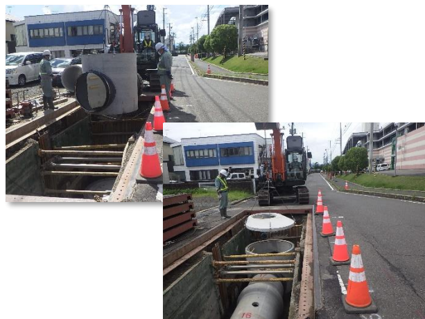
導水管(統合管)及び人孔設置状況