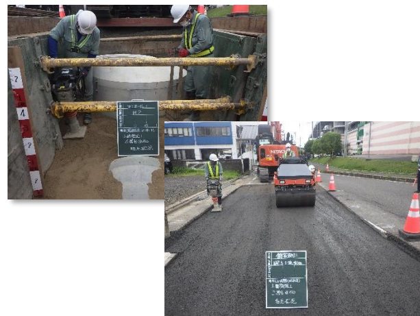
埋戻し・転圧及び舗装回復旧状況