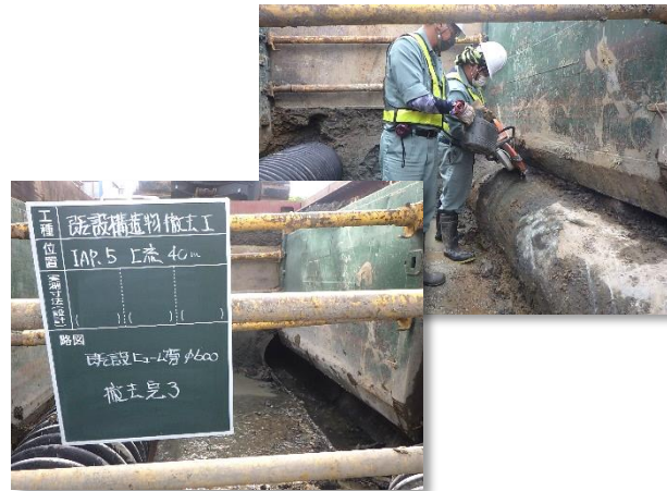
既設排水管(HP管)撤去状況