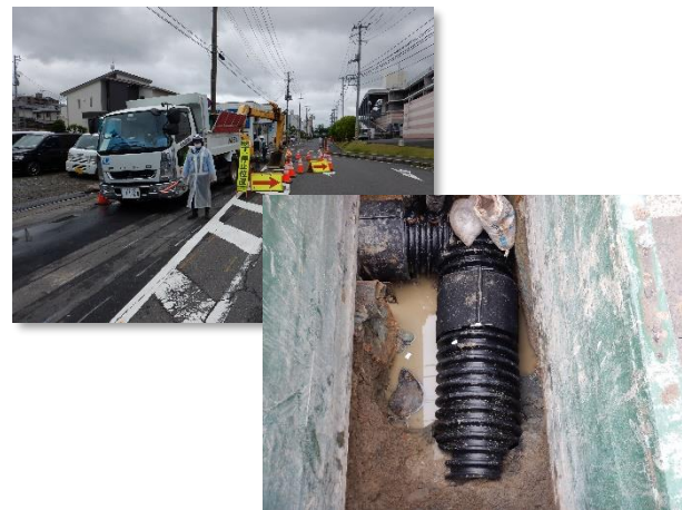
仮排水管(合流管)設置状況