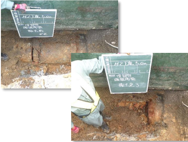
既設埋設管(陶管)撤去状況

6月は、建込簡易土留を行いながら、導水管本体設置に支障となる埋設管等の撤去及び仮排水管設置を行いました。 7月は、引き続き、仮排水管の設置を行い、導水管本体(ヒューム管)設置に着手します。