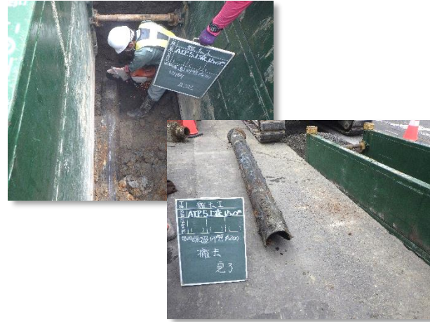
既設埋設管(ダクタイル鋳鉄管)撤去状況