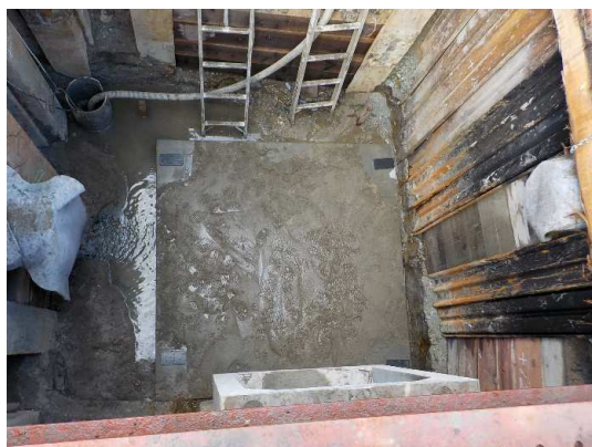
角形マンホール基礎工(7°レキャストコンクリート板設置)状況