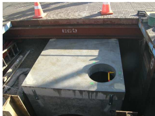
角形マンホール設置状況