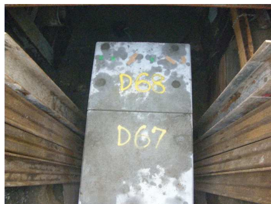
ボックスカルバート布設(完了)状況