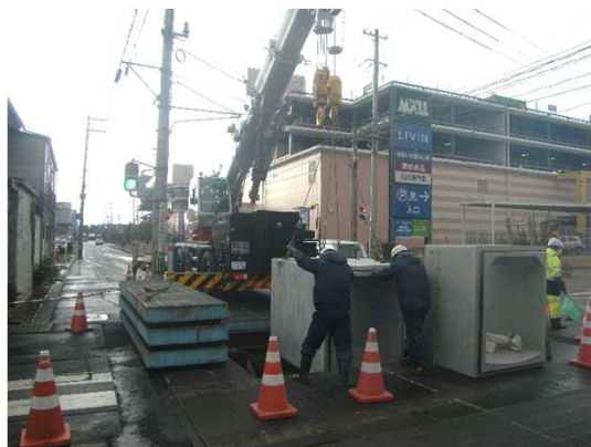
ボックスカルバート布設状況

1月は、ボックスカルバート及びヒューム管布設、角形マンホール設置(施工延長約128m完了)等を行いました。2月は、仮設土留及び覆工板の撤去、舗装仮復旧等を行い、2工区の工事が完了する見込みです。