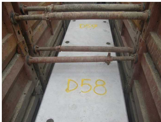
ボックスカルバート布設(完了)状況