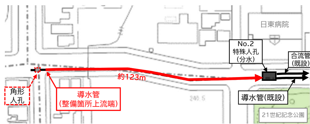
計画平面図(21世紀記念公園北西側)