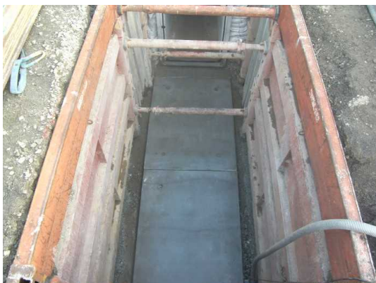
基礎工(プレキャストコンクリート板設置完了)状況

12月は、ボックスカルバート布設(約123m完了)を行いました。 1月は、引き続き、ボックスカルバート布設及び角形マンホール設置等を行います。