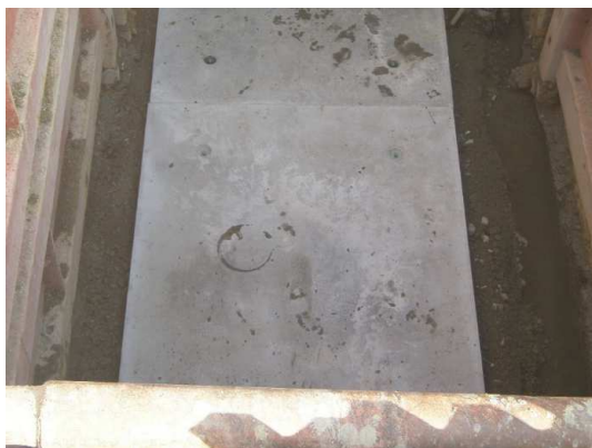
基礎工(7°レキャストコンクリート板設置完了)状況

11月は、ボックスカルバート布設(約100m完了)を行い、角形人孔設置に係る覆工板設置等を行いました。 12月は、引き続き、ボックスカルバート布設等を行います。