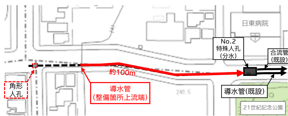
計画平面図(21世紀記念公園北西側)