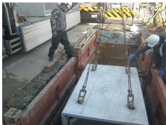
ボックスカルバート布設状況