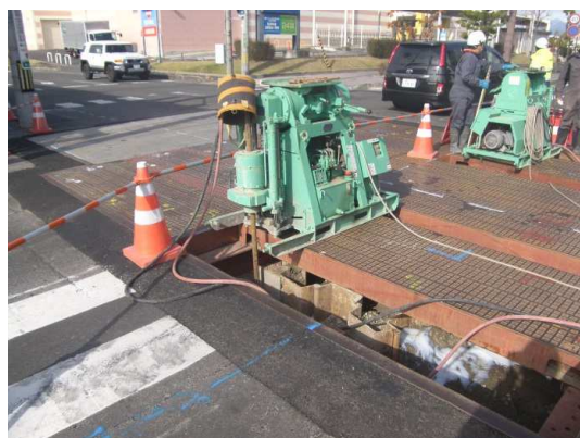
地盤改良(薬液注入)状況