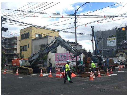
仮設土留(H鋼親杭)設置状況