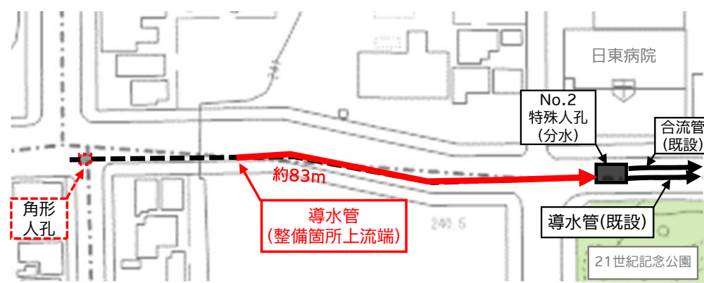
計画平面図(21世紀記念公園北西側)