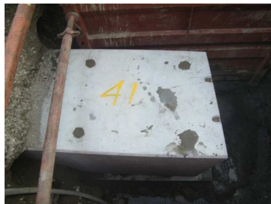
ボックスカルバート布設状況