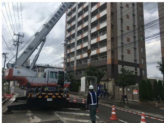
ボックスカルバート布設状況

10月は、ボックスカルバート布設(約83m完了)を行い、角形人孔設置に係る仮設土留等に着手しました。11月は、引き続き、ボックスカルバート布設等を行います。