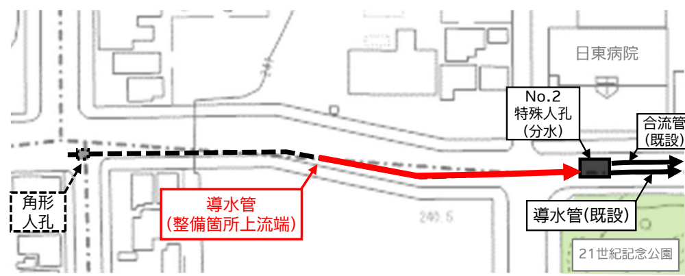
計画平面図(21世紀記念公園北西側)