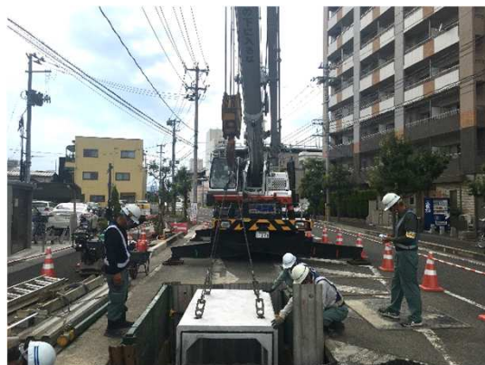
ボックスカルバート布設状況