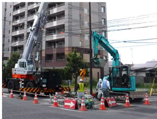
ボックスカルバート布設状況