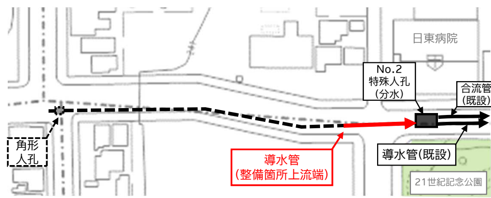
計画平面図(21世紀記念公園北西側)