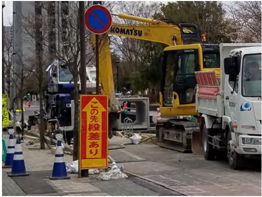
ボックスカット布設状況(No.2特殊人孔付近)

4月は、導水管本体のボックスカット布設が完了し、No.1特殊人孔(上部)のコンクリート打設が完了しました。5月は、No.2特殊人孔のコンクリート打設に着手します。