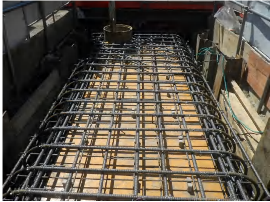
コンクリート打設(配筋・型枠完了)状況(No.1特殊人孔)