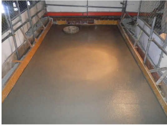
コンクリート打設完了状況(No.1特殊人孔)