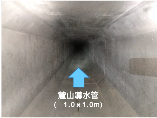
ボックスカット布設完了(内部状況)