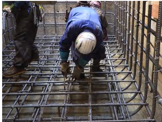
配筋状況(No.1特殊人孔)