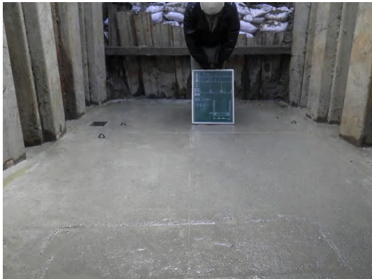
基礎工(コンクリート打設)状況(No.1特殊人孔)