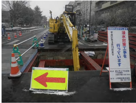
掘削(支保工)状況(No.1特殊人孔)