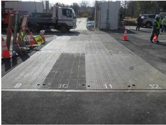
覆工板設置状況(No.1特殊人孔)

2月は、No.1特殊人孔の覆工板設置、掘削(支保工)、基礎工及び特殊人孔(底版部)の配筋を行いました。 3月は、No.1特殊人孔(底版部)のコンクリート打設を行い、導水管本体のボックスカバー布設に着手します。