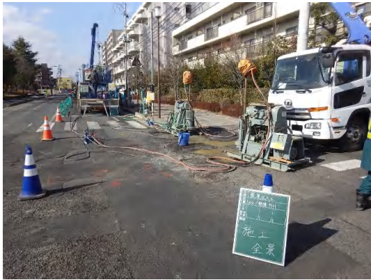
地盤改良状況(No.1特殊人孔)