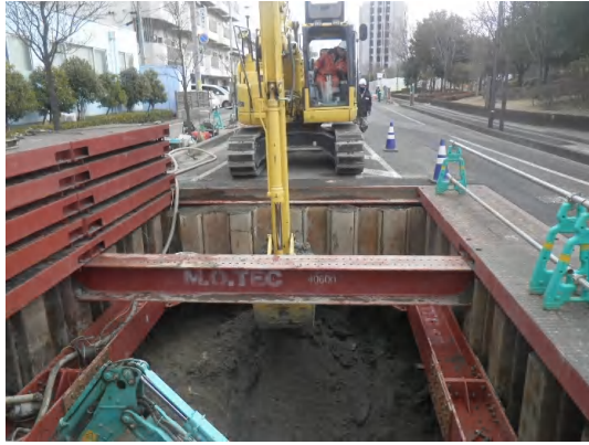
掘削(支保工)状況(No.2特殊人孔)