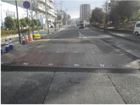
覆工板設置完了状況(No.2特殊人孔)

1月は、No.2特殊人孔の覆工板設置、掘削(支保工)、基礎工を行い、No.1特殊人孔の地盤改良を行いました。 2月は、No.1特殊人孔の覆工板設置、掘削(支保工)、基礎工、ボックスカバートの布設を行います。