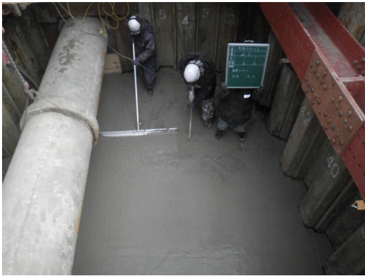
基礎工(コンクリート打設)状況(No.2特殊人孔)