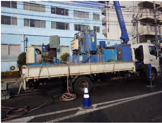
地盤改良状況(No.2特殊人孔)