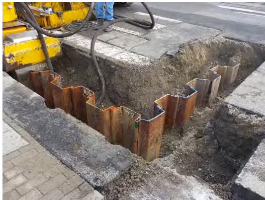
鋼矢板設置状況(No.2特殊人孔)

12月は、No.2特殊人孔の鋼矢板設置及び地盤改良を行い、No.1特殊人孔の鋼矢板設置に着手しました。 1月は、引き続き、No.1特殊人孔の鋼矢板設置を行い、地盤改良に着手します。