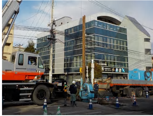
鋼矢板設置状況(No.1特殊人孔)