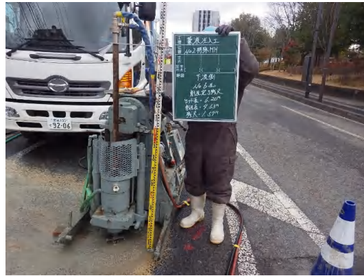
地盤改良状況(No.2特殊人孔)