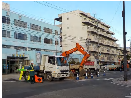
鋼矢板設置準備(舗装掘削)状況

11月は、No.2特殊人孔の仮設土留工(鋼矢板設置)に着手しました。 12月は、引き続き、No.2特殊人孔の鋼矢板設置を行い、地盤改良(薬液注入)及び覆工板設置に着手します。