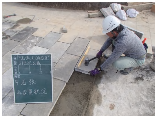
公園敷石復旧状況

3月は、公園及び歩道の復旧を行い、調整池すべての工事が完了しました。本工事へのご理解とご協力ありがとうございました。なお、供用開始については、麓山導水管築造工事第1工区完了後の7月を予定しています。