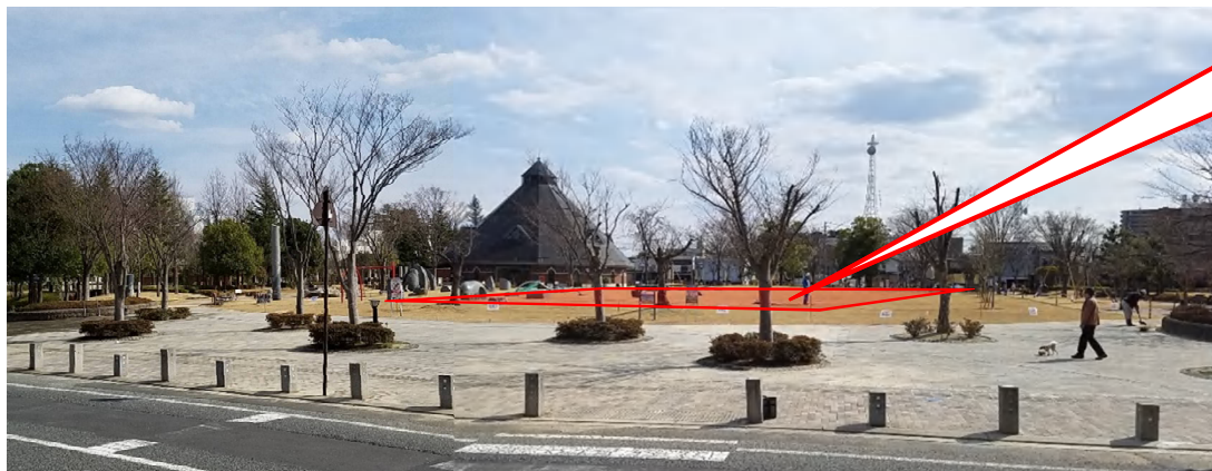
公園及び歩道復旧完了状況