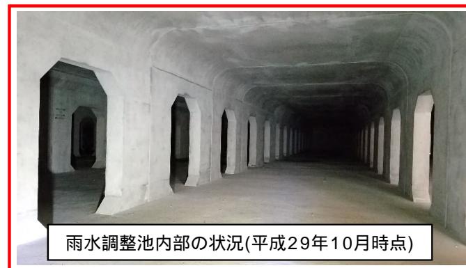
雨水調整池内部の状況(平成29年10月時点)