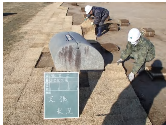
公園張芝復旧状況