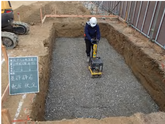
公園オブジェ(基礎工)復旧状況