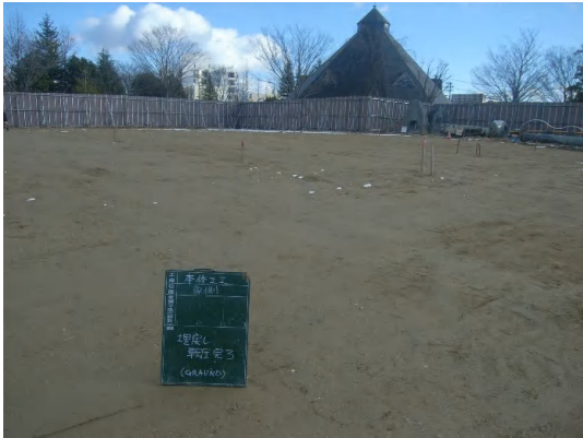
場内(公園内)埋戻し状況

1月は、場内の埋戻しを行い、一時撤去していた公園オブジェ等の復旧に着手しました。 2月は、引き続き、公園オブジェ等の復旧を行います。