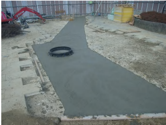
公園敷石(基礎コンクリート)復旧状況