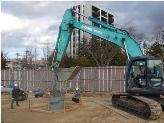
公園オブジェ復旧状況