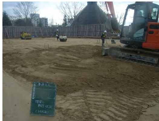
場内(公園内)埋戻し状況