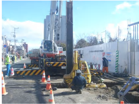
仮設土留撤去状況

12月は、流入管の仮設土留(鋼矢板、切梁腹起)を撤去し、場内(公園内)の埋戻しを行いました。 1月は、引き続き、場内の埋戻しを行い、一時撤去していた公園オブジェの復旧を行います。