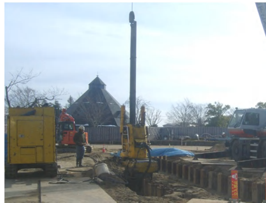
仮設土留撤去状況