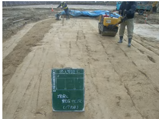
流入管埋戻し状況