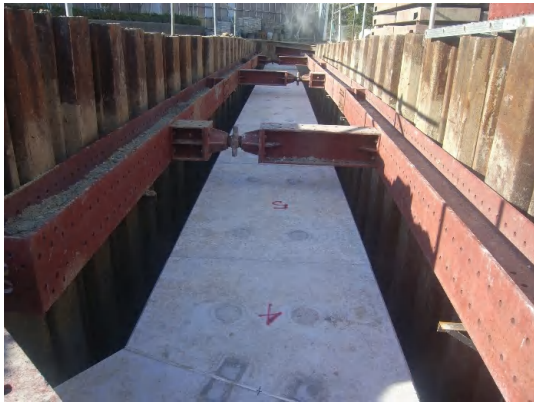
ボックスカット設置完了状況