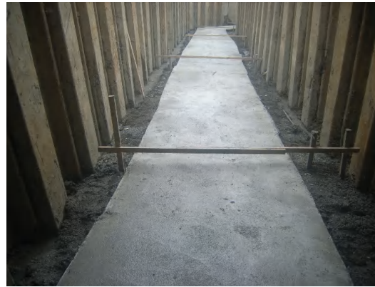
ボックスカット(基礎コンクリート)設置状況