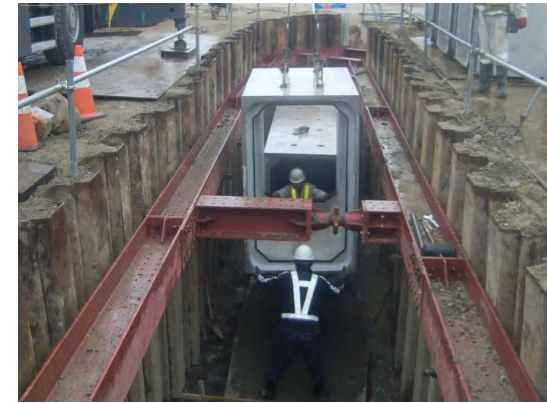
ボックスカット設置状況