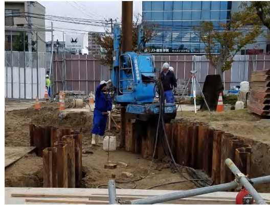
仮設鋼矢板設置状況