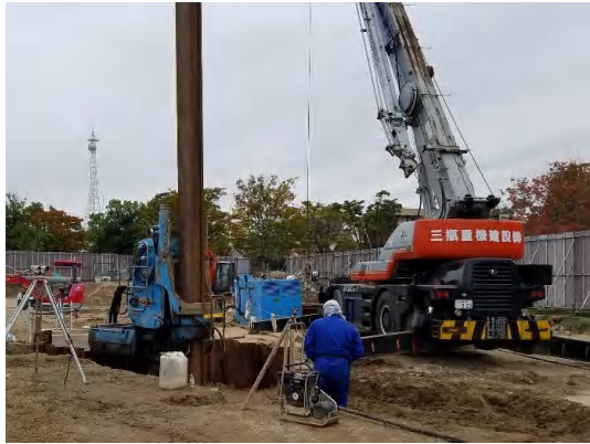
仮設鋼矢板設置状況

10月は、流入管布設に係る仮設土留工の鋼矢板設置及び覆工板設置を行いました。 11月は、流入管布設の掘削及び流入管布設に着手します。