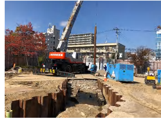
仮設鋼矢板設置状況