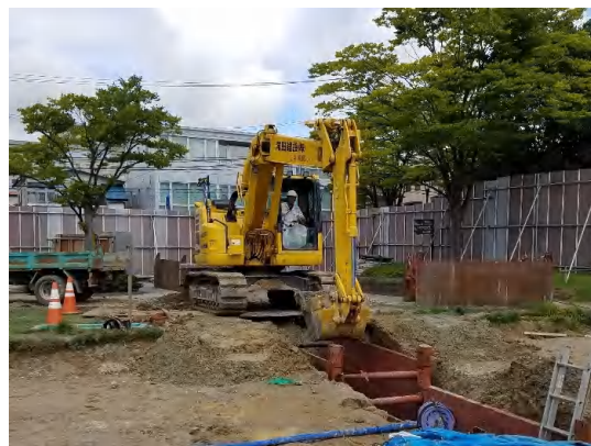
場内の放流管に係る掘削状況