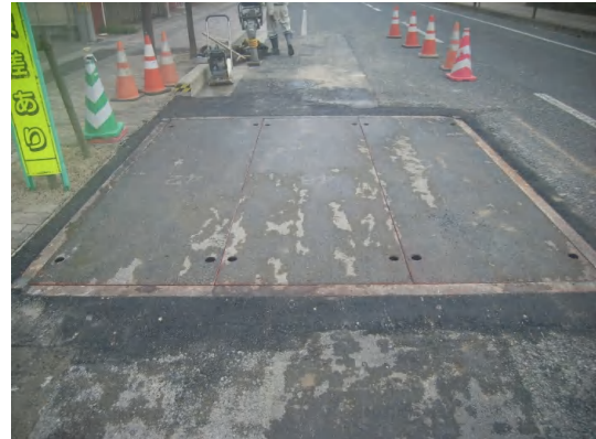
放流管、既設管の合流点施工状況