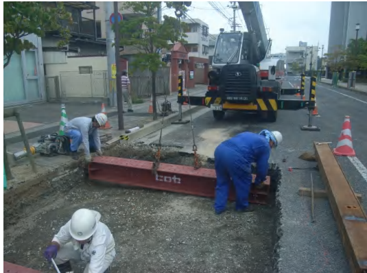
放流管、既設管の合流点施工状況