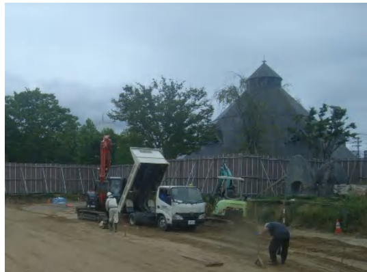
雨水調整池の埋戻し状況

9月は、雨水調整池の埋戻しを行い、放流管布設に着手しました。 10月は、放流管布設を引き続き行い、流入管布設に着手します。