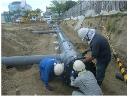
貯留ブロック上部(東側)の排気管設置状況

8月は、貯留ブロック上部の排気管設置及び埋戻しを行いました。 9月は、埋戻しを引き続き行い、既設合流管に放流管を接続するためのマンホール設置に着手します。