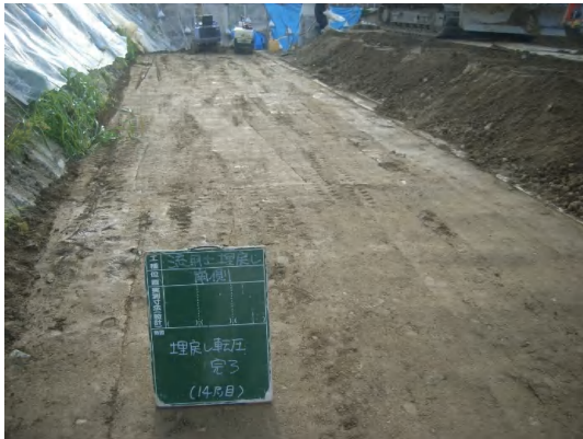
貯留ブロック周囲(南側)の埋戻し状況