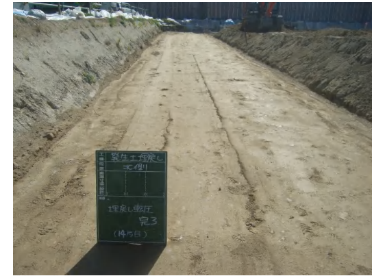
貯留ブロック周囲(北側)の埋戻し状況