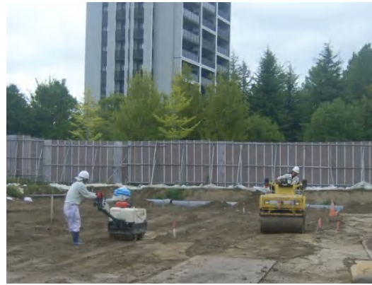
貯留ブロック上部の埋戻し状況