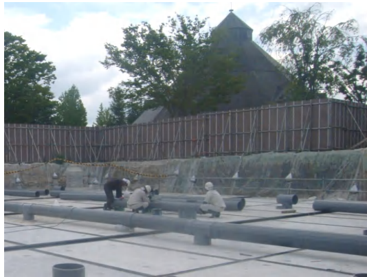
貯留ブロック上部の排気管設置状況