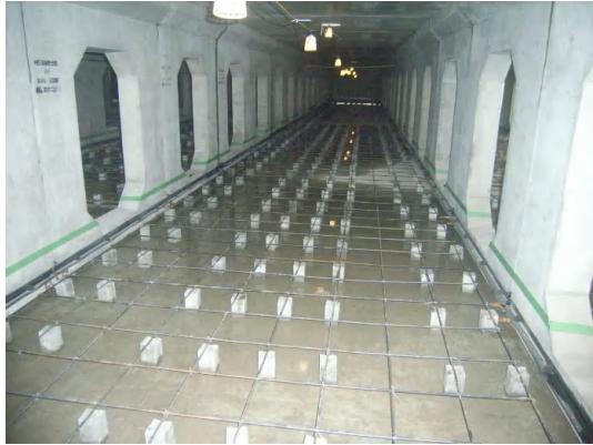
インバートコンクリート(配筋)施工状況

7月は、インバートコンクリート(配筋・打設)、貯留ブロックの防水工及び上部排気管設置を行いました。 8月は、引き続き、貯留ブロック上部の排気管設置及び埋戻し等を行います。