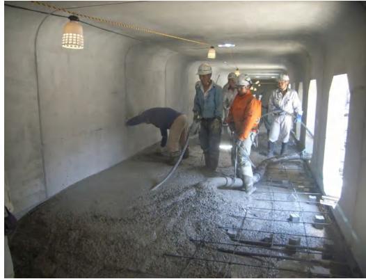
インバートコンクリート打設状況