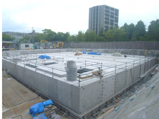
貯留ブロック設置完了(全景)