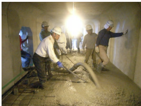
インバートコンクリート打設状況