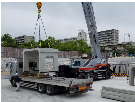
貯留ブロック設置状況

6月は、貯留ブロック設置を完了し、調整池内部のインバートコンクリート(配筋・打設)に着手しました。 7月は、インバートコンクリート(配筋・打設)、貯留ブロック継ぎ目の防水工及び上部排気管設置を行います。