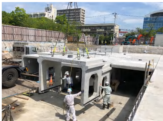
貯留ブロック設置状況