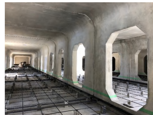
インバートコンクリート(配筋) 施工状況