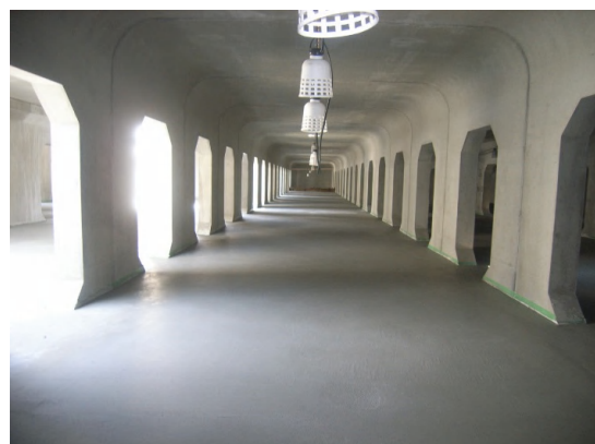
インバートコンクリート一部完了状況