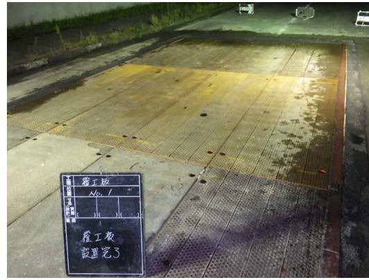
覆工板設置完了状況