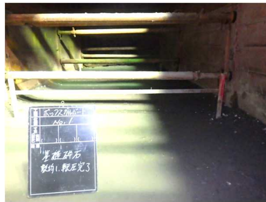
基礎工(砕石転圧完了)状況