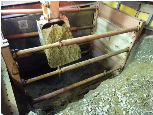
掘削・建込簡易土留設置状況