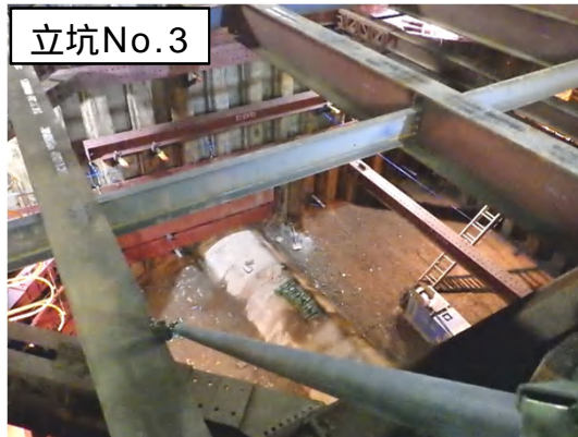
仮設土留設置状況