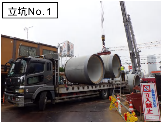
推進工法(ヒューム管搬入)状況