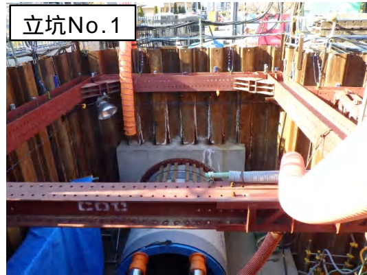
推進工法(ヒューム管布設)状況