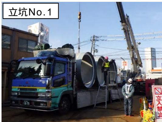
推進工法(ヒューム管搬入)状況