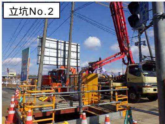
特殊人孔の基礎工(コンクリート打設)状況