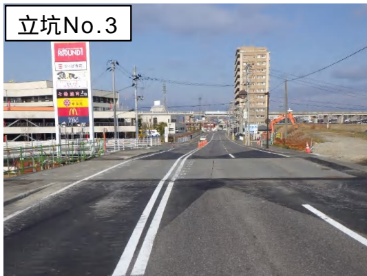
覆工板設置完了状況