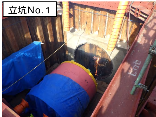
立坑No.1 鏡切(仮設鋼矢板ガス切断)状況