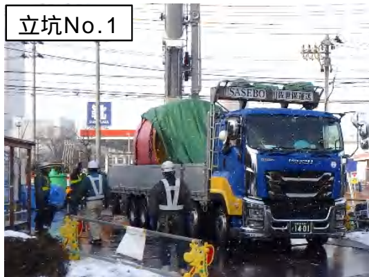
立坑No.1 掘進機搬入状況