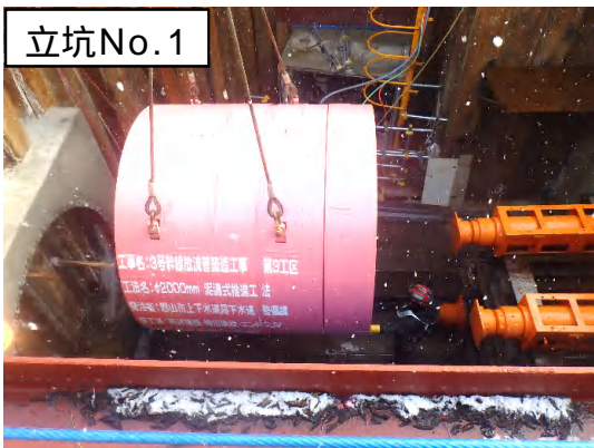
立坑No.1 掘進機据付状況