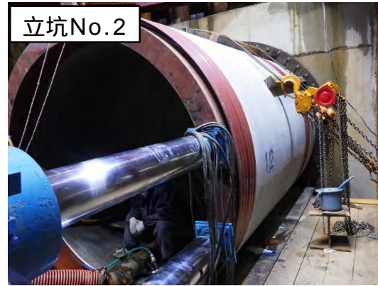
推進工法(LUM管布設)状況