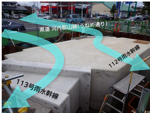
分水人孔築造完了状況

7月は、到達立坑に隣接する分水人孔(2次施工分)築造が完了し、仮設土留撤去及び埋戻し等を行いました。 8月は、県道及び市道の舗装復旧等を行い、第3工区すべての工事が完了する見込みです。