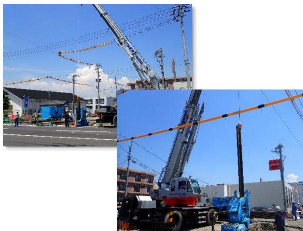
仮設土留(鋼矢板)撤去状況