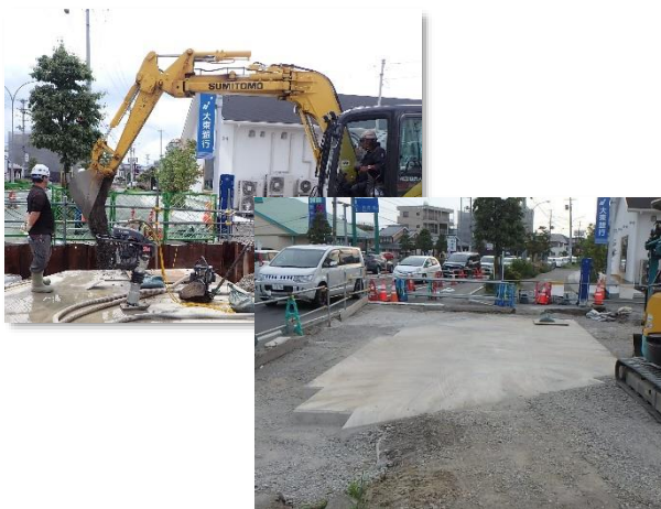
埋戻し・転圧完了状況