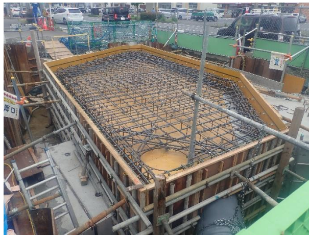
分水人孔築造(配筋・型枠設置完了)状況