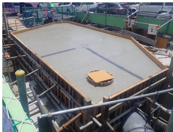
分水人孔築造(コンクリート打設完了)状況