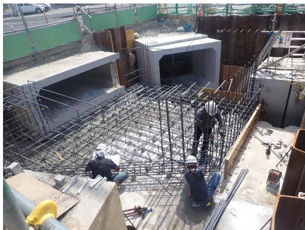
分水人孔築造(配筋)状況

6月は、到達立坑に隣接する分水人孔(2次施工分)築造(配筋・型枠設置・コンクリート打設)等を行いました。 7月は、分水人孔(2次施工分)築造完了後に埋戻し、仮設土留の撤去等を行います。