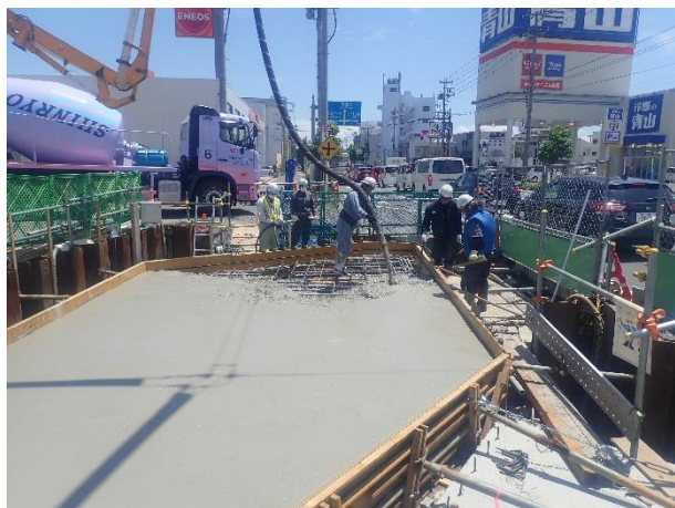
分水人孔築造(コンクリートポンプ車打設)状況