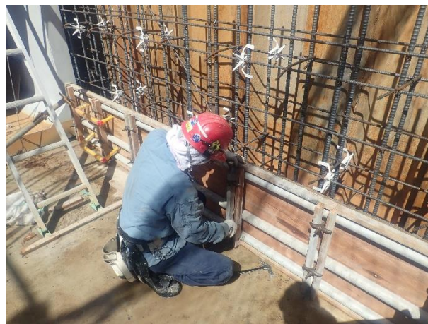
分水人孔(1次施工分)築造(型枠)状況