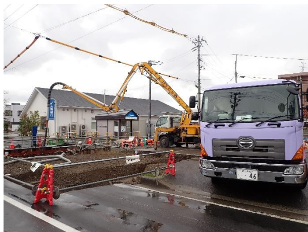
分水人孔(1次施工分)築造(コンクリートポンプ車打設)状況