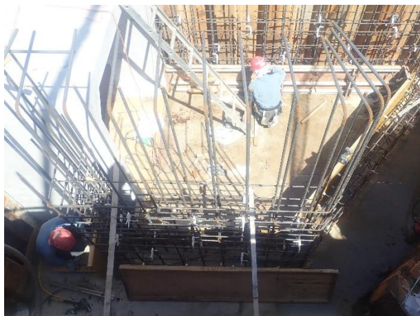
分水人孔(1次施工分)築造(配筋)状況

4月は、到達立坑内の分水人孔(1次施工分)築造に係るコンクリート打設等を行いました。 5月は、引き続き、分水人孔(2次施工分)築造等を行います。