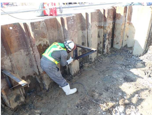
仮設土留支保工状況