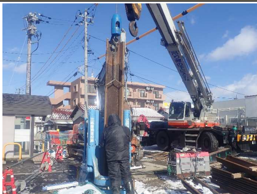
仮設土留(鋼矢板)設置状況