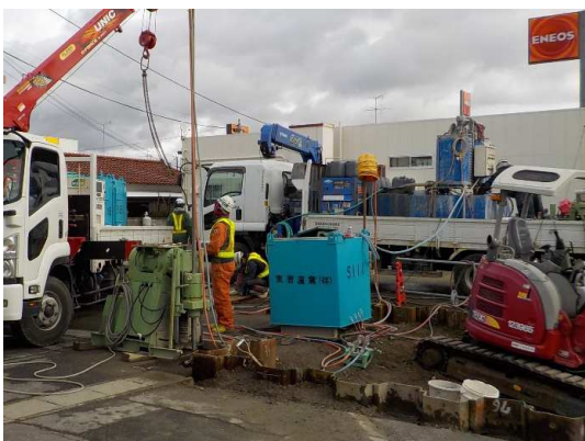
地盤改良(薬液注入)状況