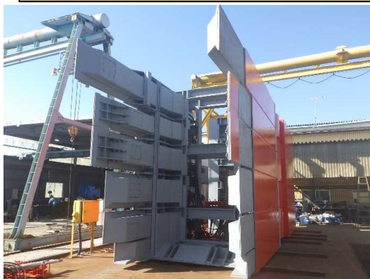
オープンシールド機(R2.2月工場仮組検査時点)

1月は、2工区のオープンシールド機の到達立坑に係る仮設土留設置及び地盤改良(薬液注入)を行い、掘削に着手しました。 2月は、引き続き、到達立坑の掘削等を行います。